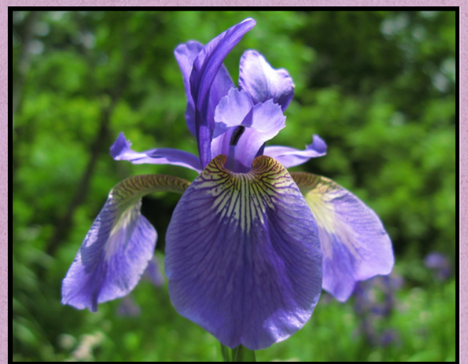
Ayame ( Iris sanguinea )