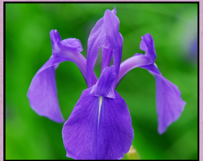
Kakitsubata ( Iris laevigata )