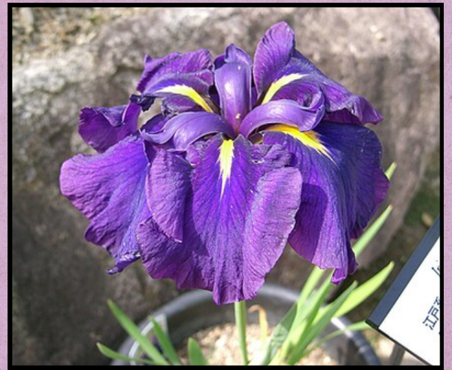
Hanashōbu ( Iris ensata )

Interesanti: lai apzīmētu konkrētu “īrisa” krāsu, ir vienkārši jāpievieno galotne “-iro” (色): kakitsubata-iro (杜若色), ayame-iro (菖蒲色), shōbu-iro* (菖蒲色).