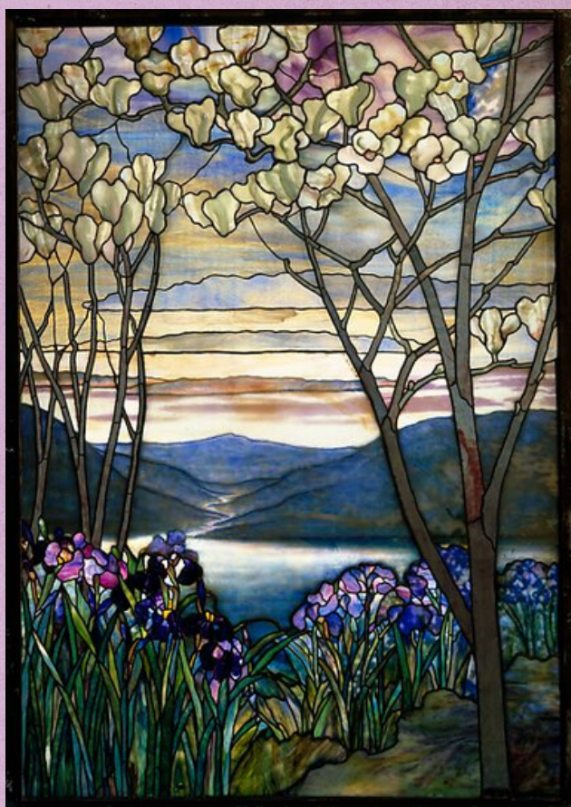
Luiss K. Tifanijs. “Magnolijas un īrisi”. 1905

Īrisi bija labi pazīstami jau senajās civilizācijās, taču tieši jūgendstila periodā īrisi kļuva par “kulta ziedu” un bija viens no visbiežāk attēlotajiem motīviem mākslā. 1