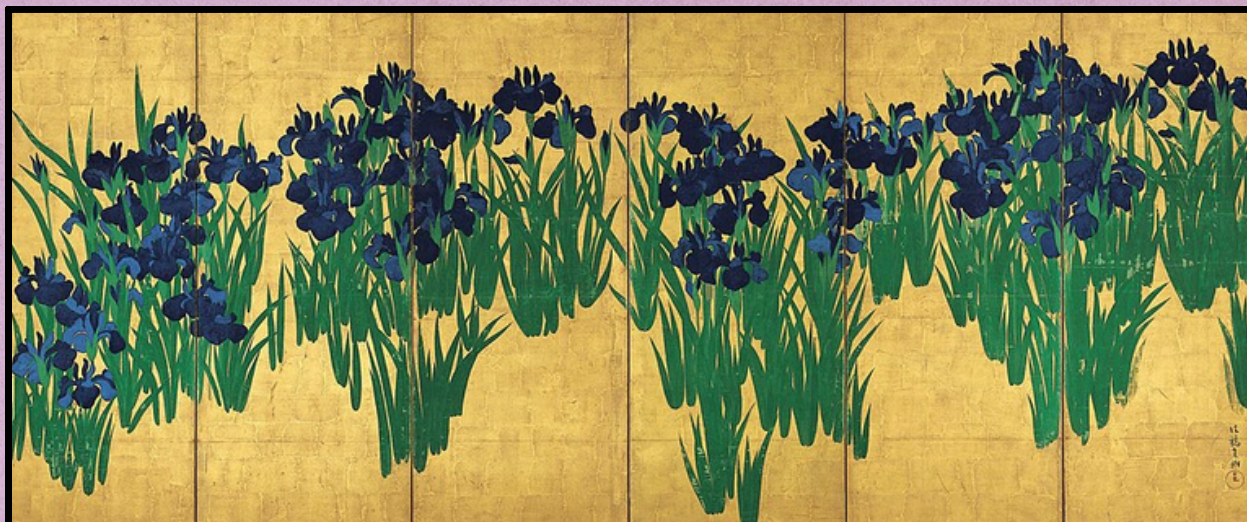
Ogata Kōrin. “ Īrisi ” (紙本金地著色燕子花園). apm. 1701–1705

* Var teikt arī “hanashōbu-iro” (花菖蒲色), un jūs tiksiet saprasts, tomēr biežāk lieto vārdu „shōbu-iro“, jo šis nosaukums jau sen ir kļuvis par tradicionālu krāsas nosaukumu. Vārds „hanashōbu“ parādījās vēlāk.