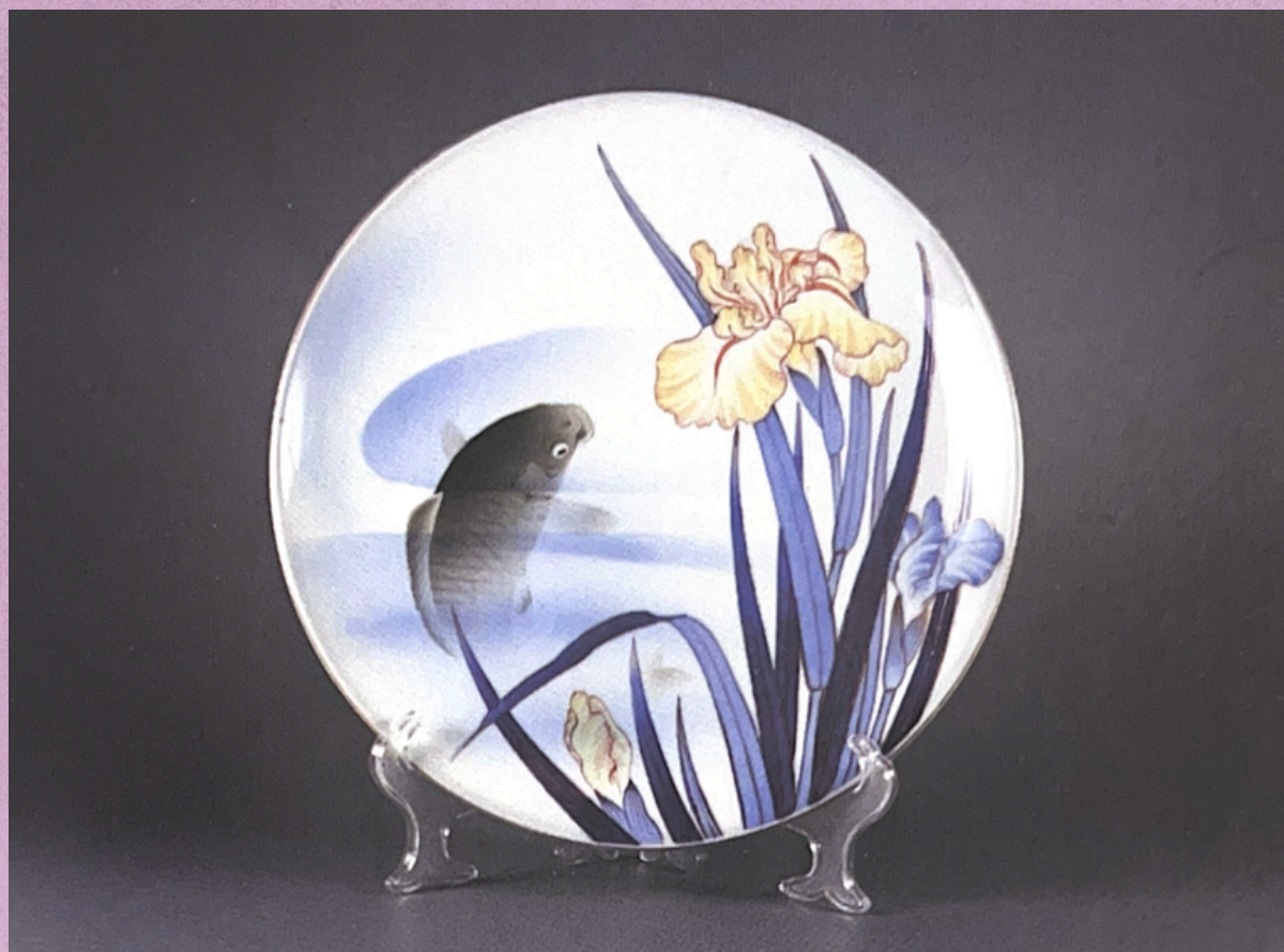
Šķivis. Porcelāns. Japāna. 19.–20. gs. mija.